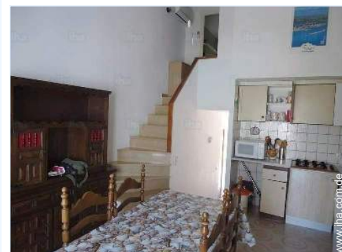
Raumaufteilung und Annehmlichkeiten