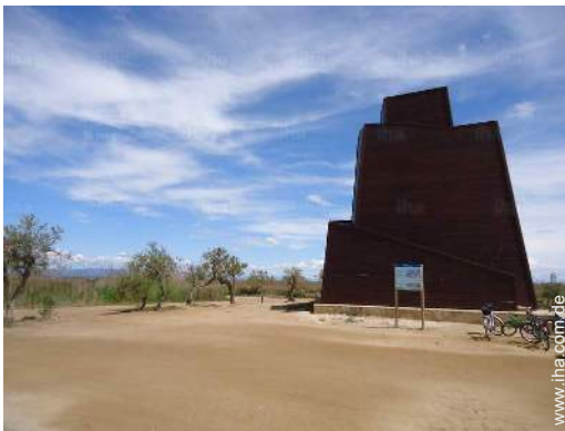
In der Nähe