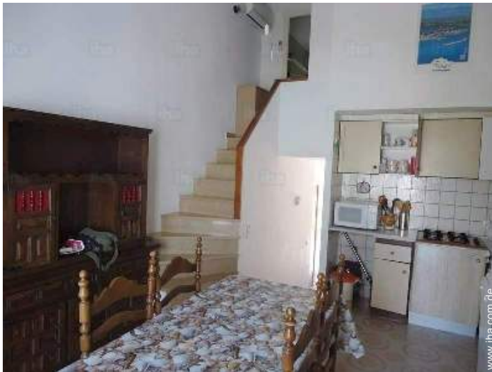
Raumaufteilung und Annehmlichkeiten