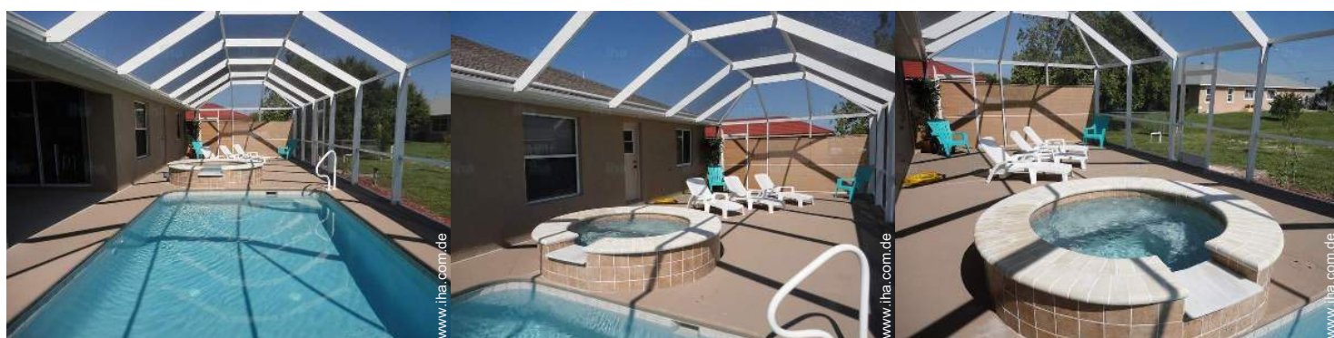
Blick auf Swimmingpool