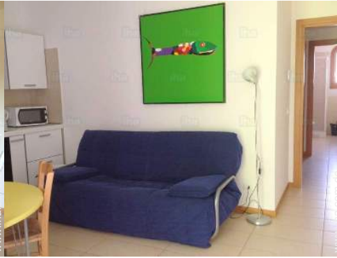
Sofabett(en) 2 Personen