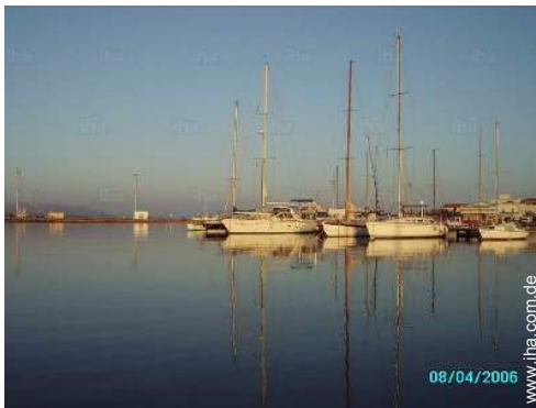
Blick auf Hafen