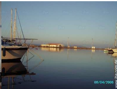
Blick auf Hafen