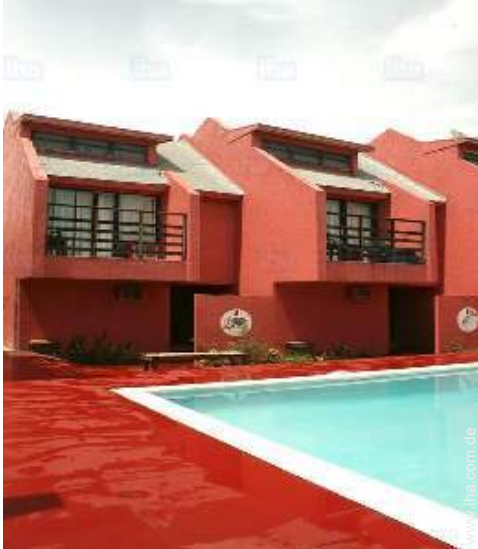
Blick auf Swimmingpool