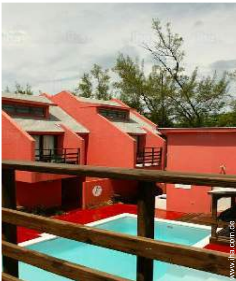
Blick auf Swimmingpool