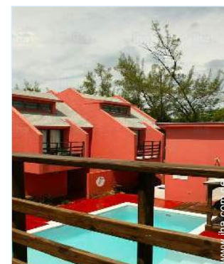
Blick auf Swimmingpool