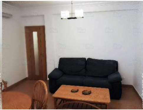
Innenkomfort und Ausstattung