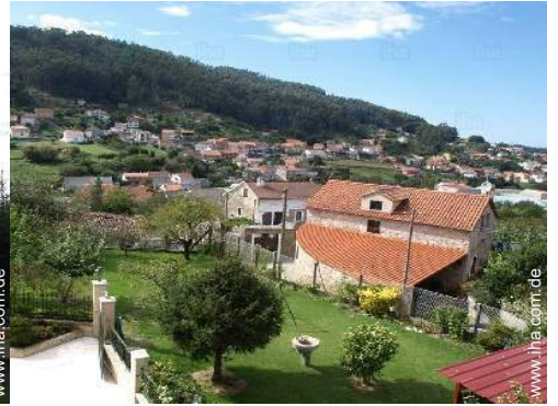
Blick auf Garten/Park