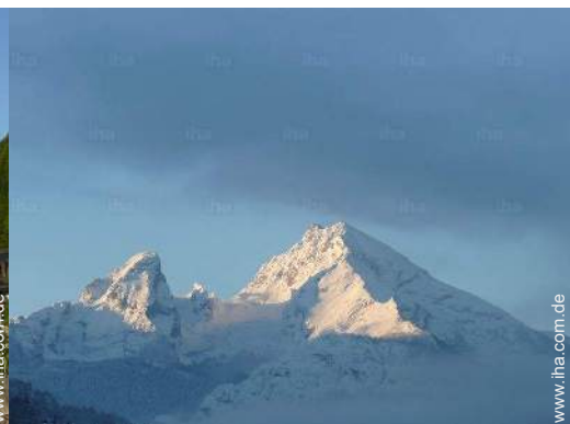
Blick auf Gebirge