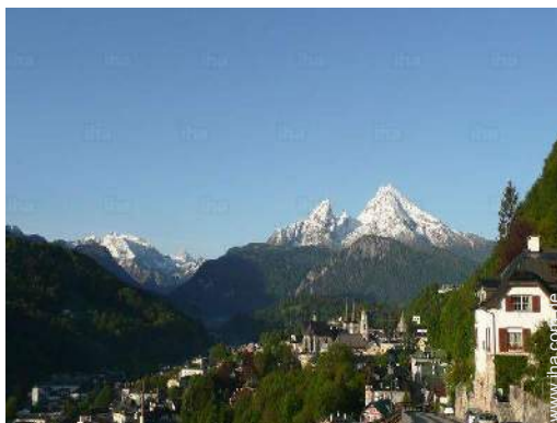
Nahe gelegene Städte