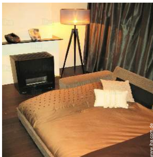
Sofabett(en) 2 Personen