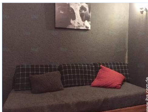
Ausziehbett(en) 1 Person