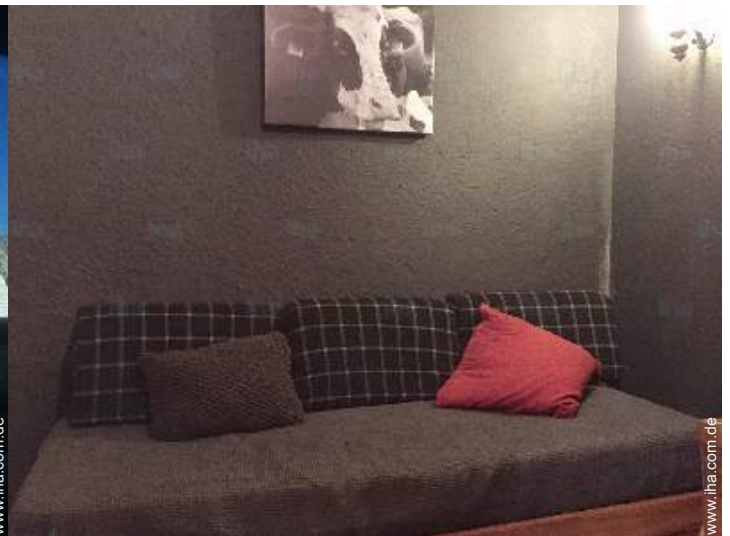
Ausziehbett(en) 1 Person