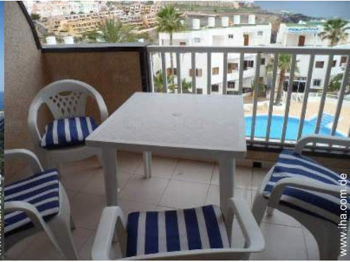
Blick auf Swimmingpool