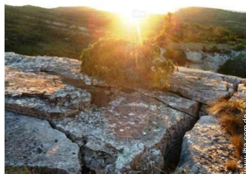
Blick auf Sonnenuntergang