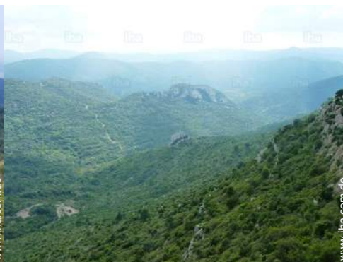
Blick aufs Land