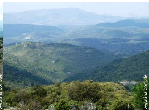
Blick aufs Land