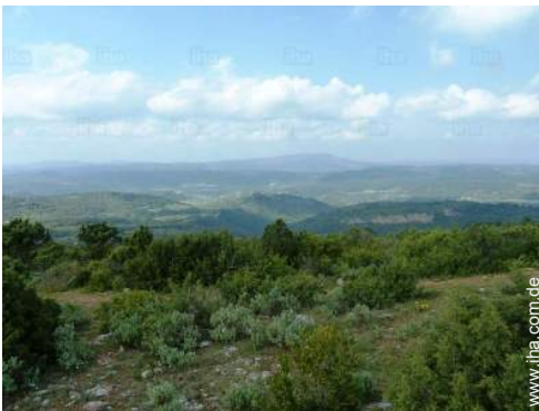
Blick aufs Land