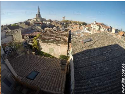
Blick auf Dächer