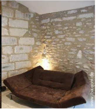
Sofabett(en) 2 Personen