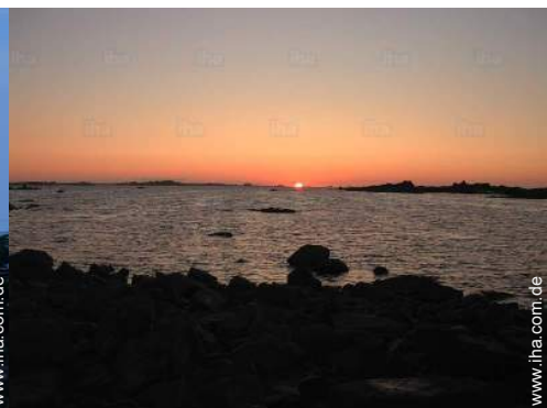
Blick auf Sonnenuntergang