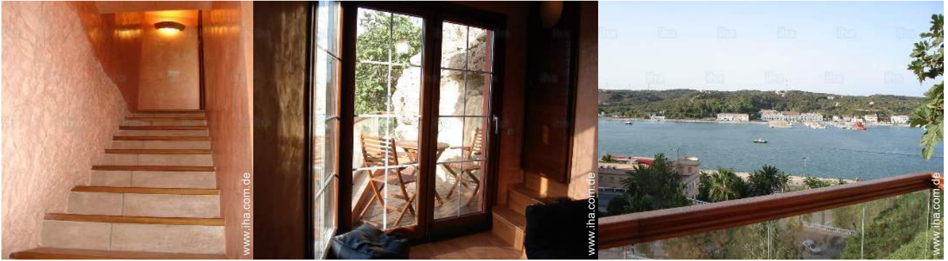
Anwesen mit Charme