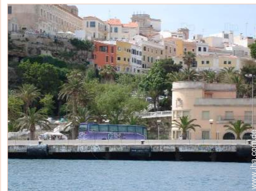
Haus mit Charme