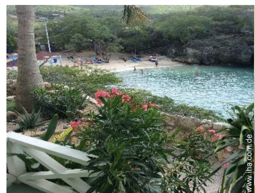
Ausblick überdachte Terrasse