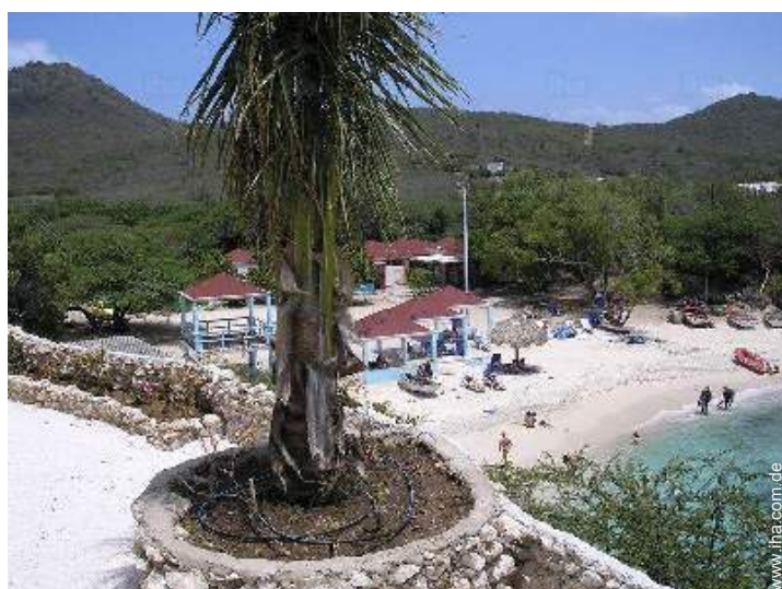
Ausblick überdachte Terrasse