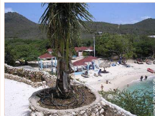
Ausblick überdachte Terrasse

Bushaltestelle <50m Autovermietung <50m Tauchausstattungsverleih <50m Wäscherei/Wäscheverleih <50m Örtliche Geschäfte 300m Supermarkt 3km Bank 3km Geldautomat 3km Apotheke 3km Arzt 3km Krankenhaus 25km