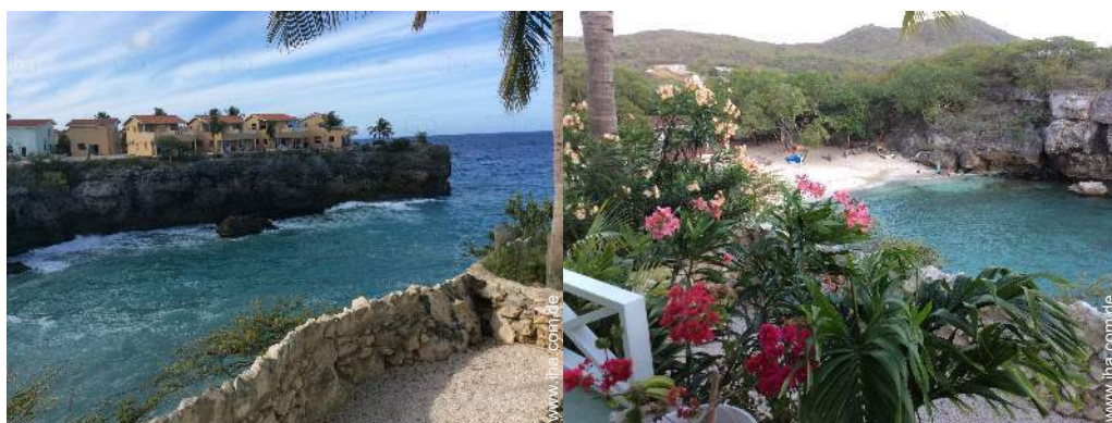
Ausblick überdachte Terrasse