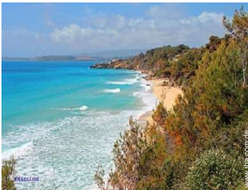
Badevergnügen in der Nähe