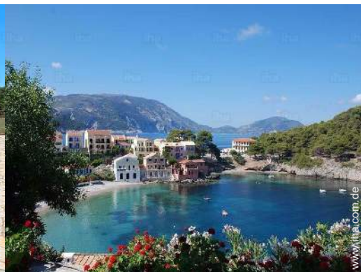
Badevergnügen in der Nähe