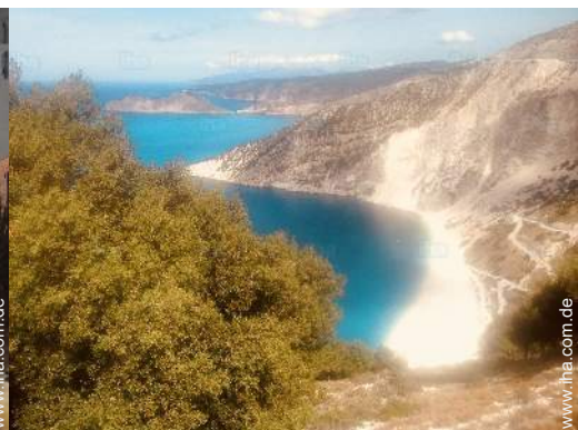
Badevergnügen in der Nähe