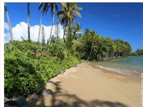
Anwesen mit Charme