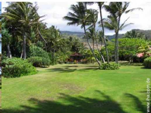
Blick auf Garten/Park