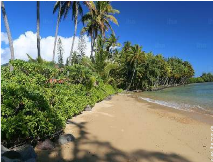
Anwesen mit Charme