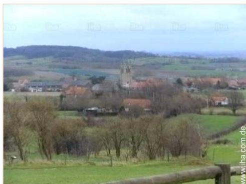
Blick auf Dorf