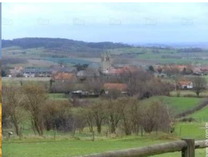
Blick auf Dorf