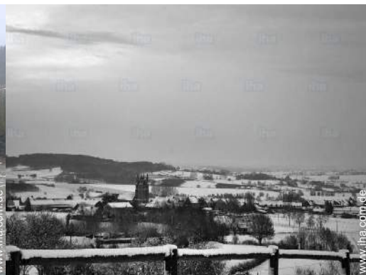
Blick auf Dorfzentrum