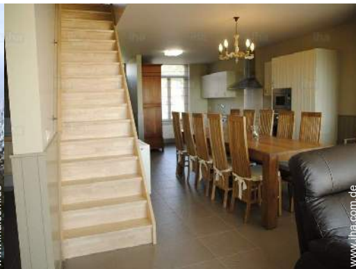
Raumaufteilung und Annehmlichkeiten