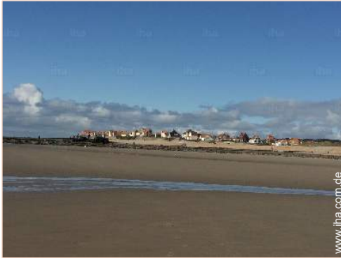
Blick aufs Meer