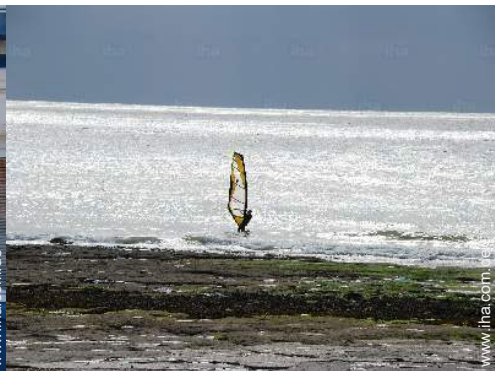
Freizeitaktivitäten in der Nähe