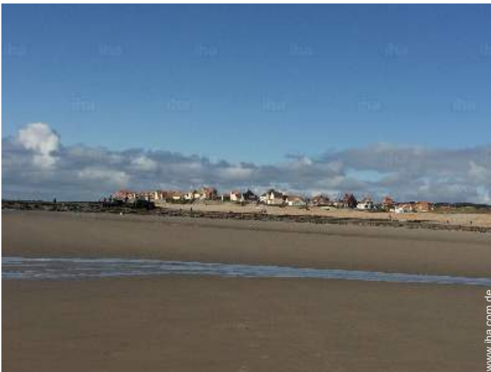
Blick aufs Meer