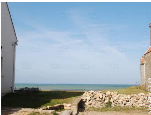
Blick aufs Meer