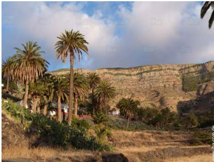
Blick auf Gebirge