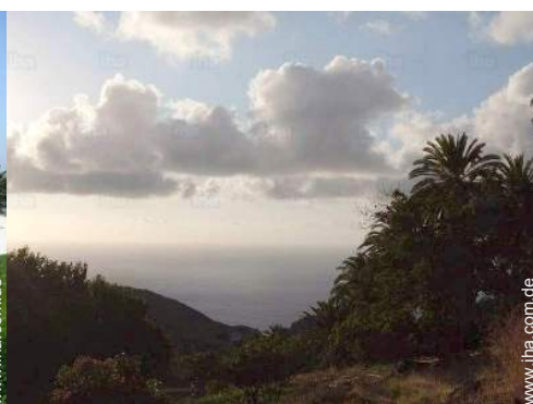
Blick auf Sonnenuntergang