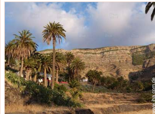
Blick auf Gebirge