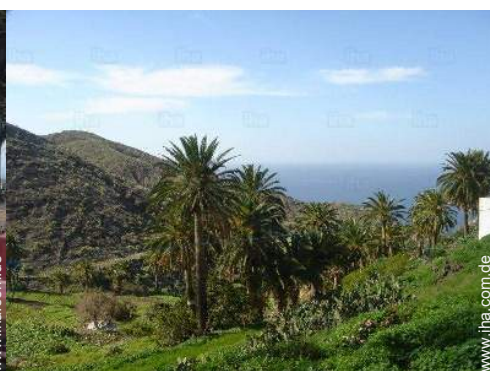
Blick aufs Meer