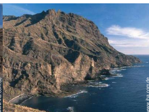
direkter Zugang zum Strand