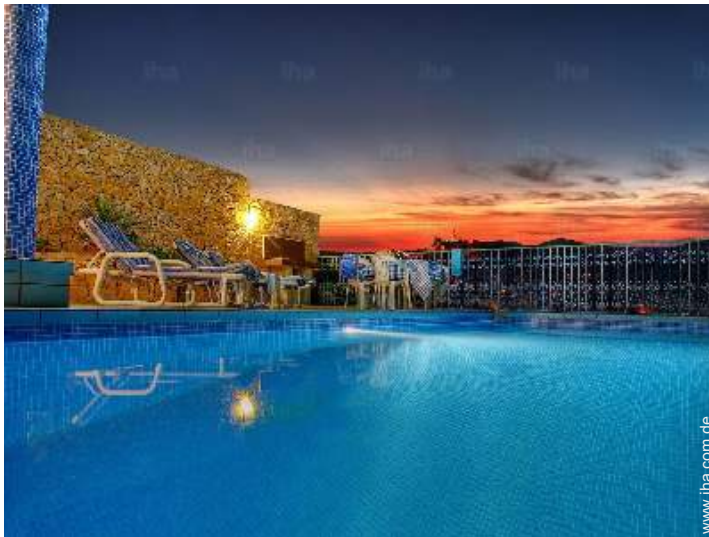
Blick auf Swimmingpool