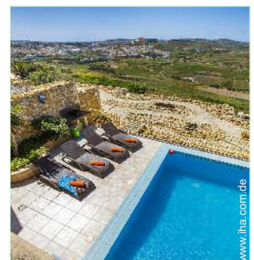
Blick auf Swimmingpool