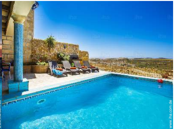
Blick auf Swimmingpool