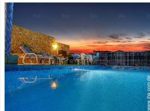
Blick auf Swimmingpool