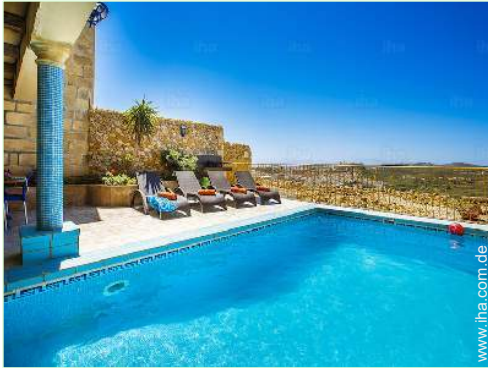
Blick auf Swimmingpool