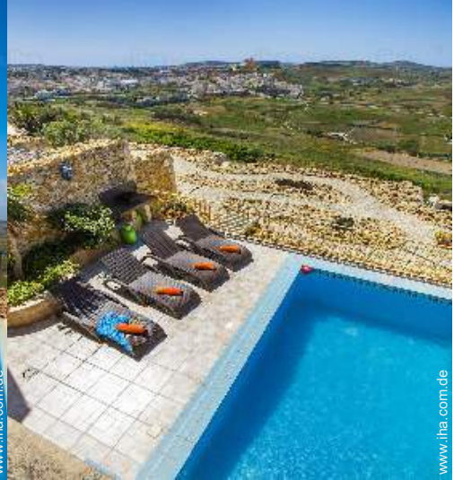
Blick auf Swimmingpool