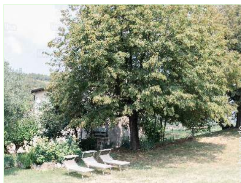
Äußerer Rahmen zur Verfügung der Gäste