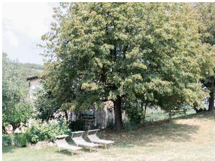
Äußerer Rahmen zur Verfügung der Gäste