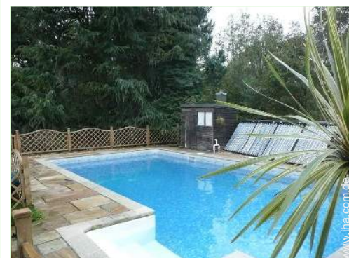
Blick auf Swimmingpool