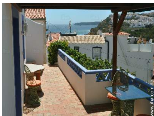
Blick aufs Meer