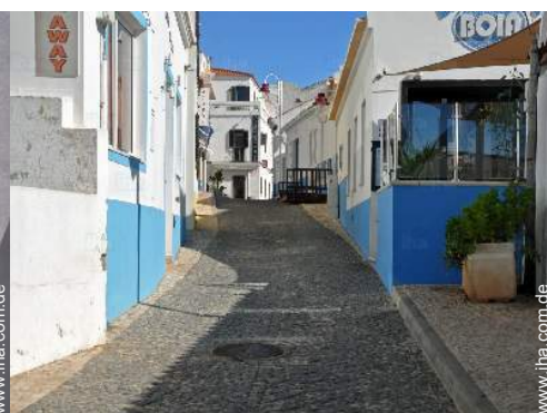
In der Nähe