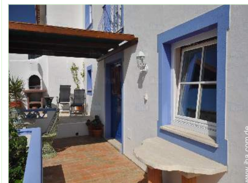
Außenanlage zur Verfügung der Gäste