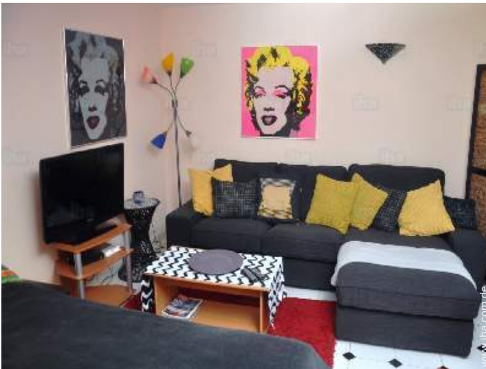
Innenkomfort und Ausstattung