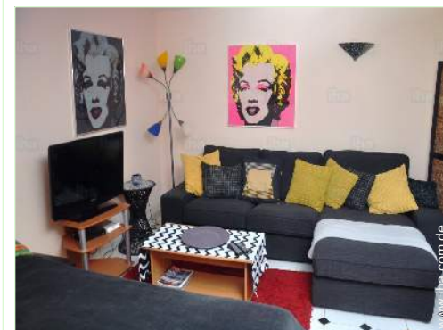
Innenkomfort und Ausstattung

Dorfzentrum 300m Stadtzentrum 20km Bushaltestelle 500m Fahrrad-/Mountainbikeverleih 500m Örtliche Geschäfte 500m Supermarkt 300m Internetcafé 500m Geldautomat 4km Apotheke 7,5km Krankenhaus 15km