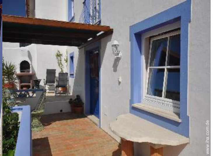
Außenanlage zur Verfügung der Gäste