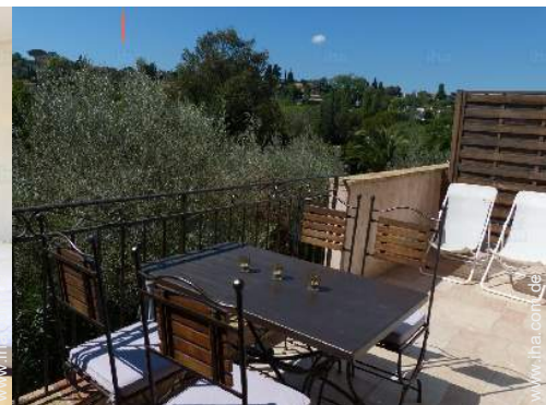
Blick aufs Land