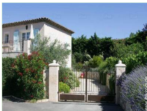
Anwesen mit Charme