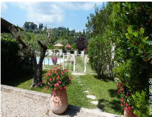
Swimmingpool in Wohnanlage