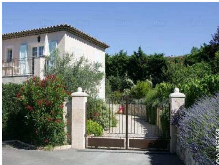
Anwesen mit Charme