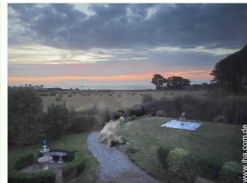
Blick auf Sonnenuntergang