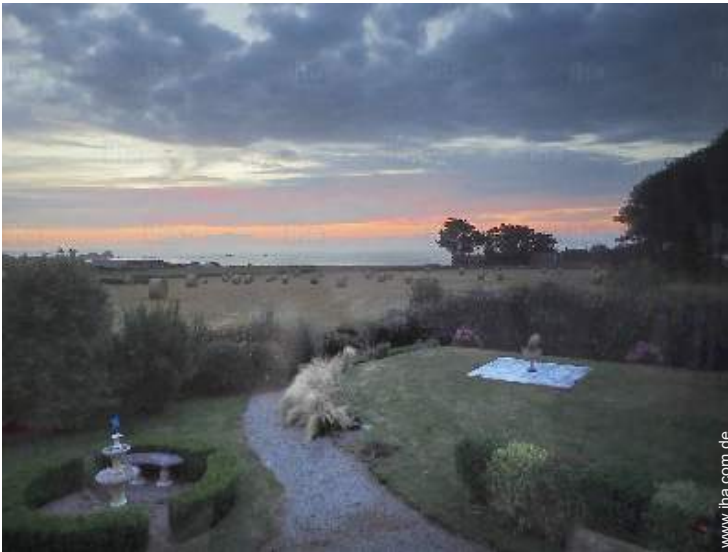
Blick auf Sonnenuntergang