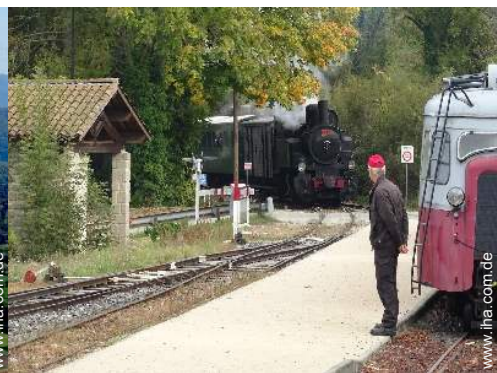
Sommeraktivitäten in der Nähe