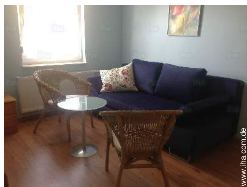
Sofabett(en) 2 Personen