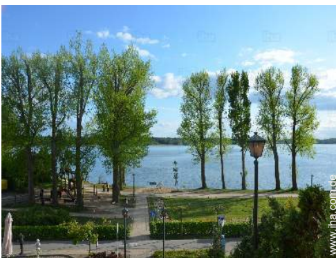
Nahe gelegene Städte