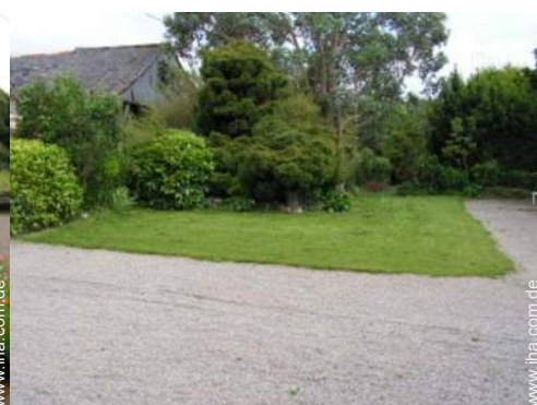
Blick auf Hof