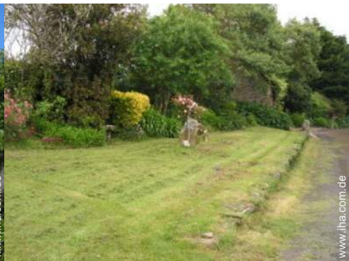
Äußerer Rahmen zur Verfügung der Gäste