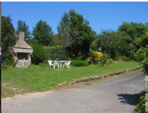
Außenanlage zur Verfügung der Gäste