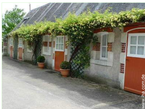
Steinhaus mit Charme