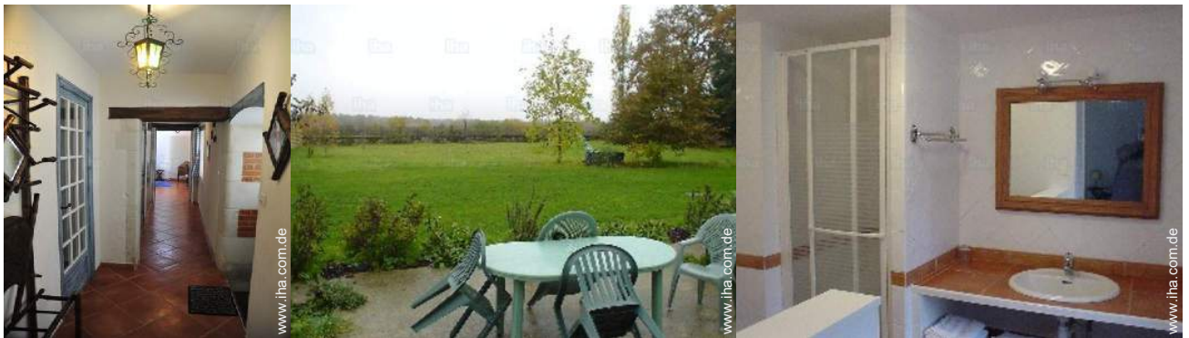
Raumaufteilung und Annehmlichkeiten