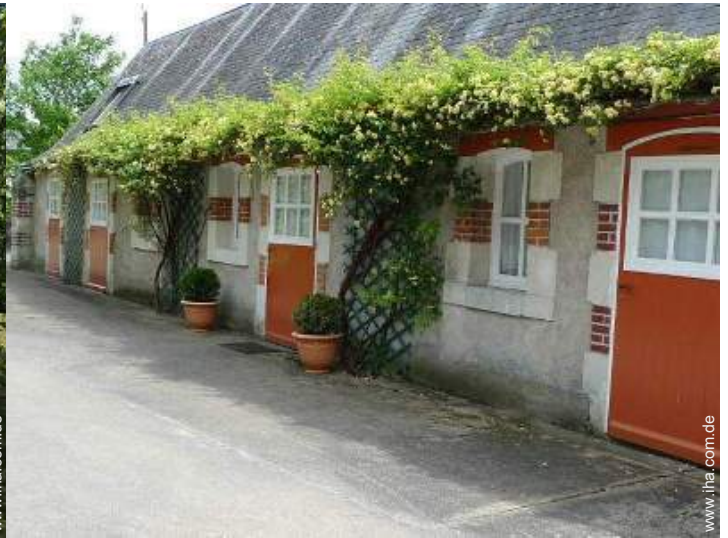
Steinhaus mit Charme