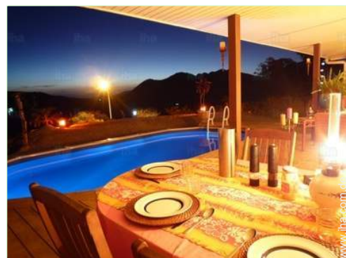
Table d'Hôte (Gemeinschaftstafel)