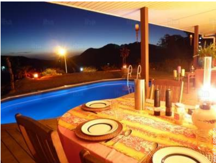
Table d'Hôte (Gemeinschaftstafel)