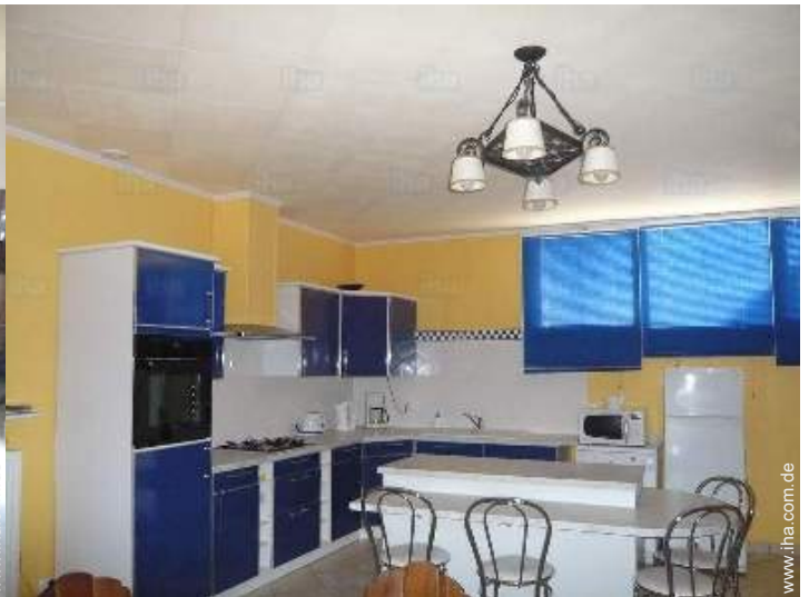
große separate Küche