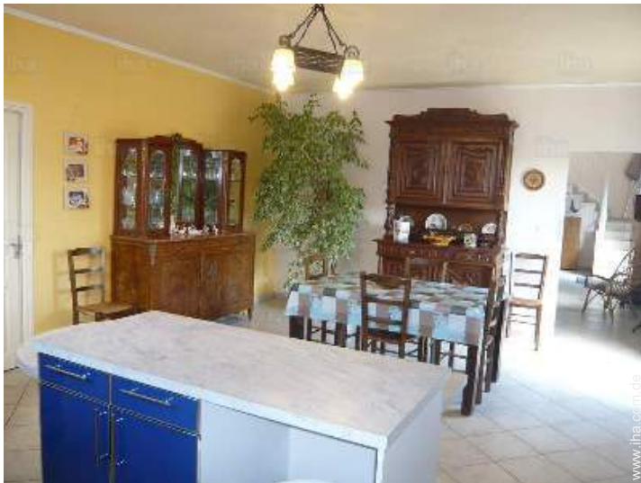
große separate Küche