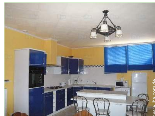
große separate Küche

Dorfzentrum <50m Bäckerei <50m Feinkosthändler <50m Örtliche Geschäfte <50m Supermarkt 7,5km Luxus-/Markenboutiquen 25km Friseursalon <50m Post <50m Bank <50m Geldautomat <50m Apotheke <50m Arzt <50m Krankenschwester <50m Krankenhaus 15km