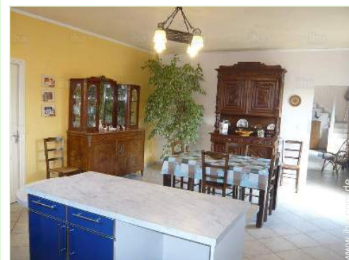
große separate Küche