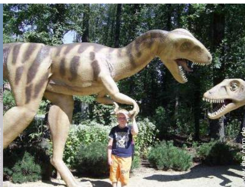
Attraktionen und Entspannung