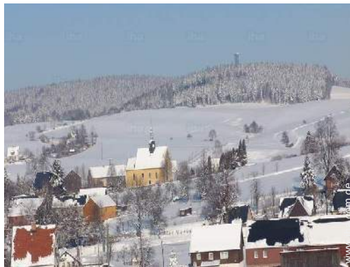
Blick auf Dorf