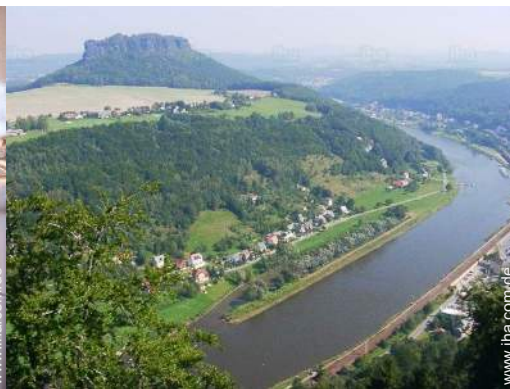
Blick auf Gebirge