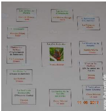
Park und Garten