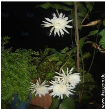
Ausblick überdachte Terrasse