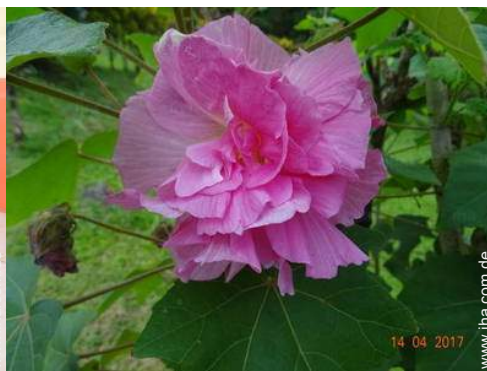
Ausblick überdachte Terrasse