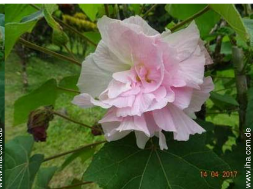
Ausblick überdachte Terrasse