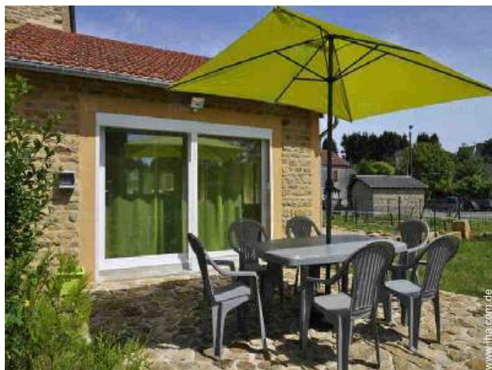
Außenanlage zur Verfügung der Gäste