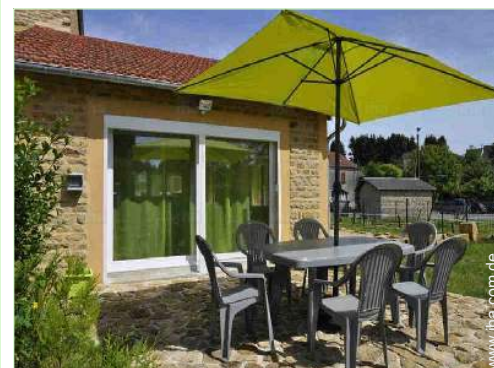
Außenanlage zur Verfügung der Gäste