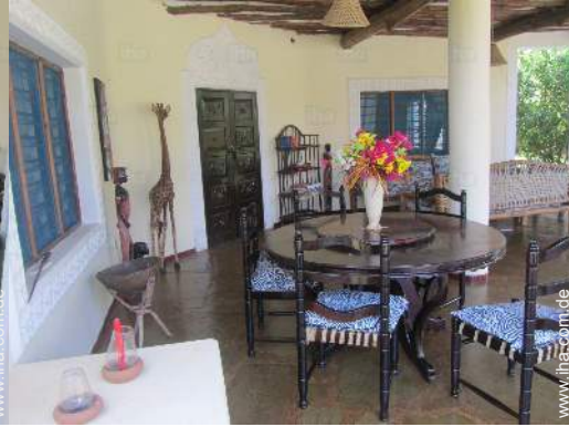
Ausblick überdachte Terrasse