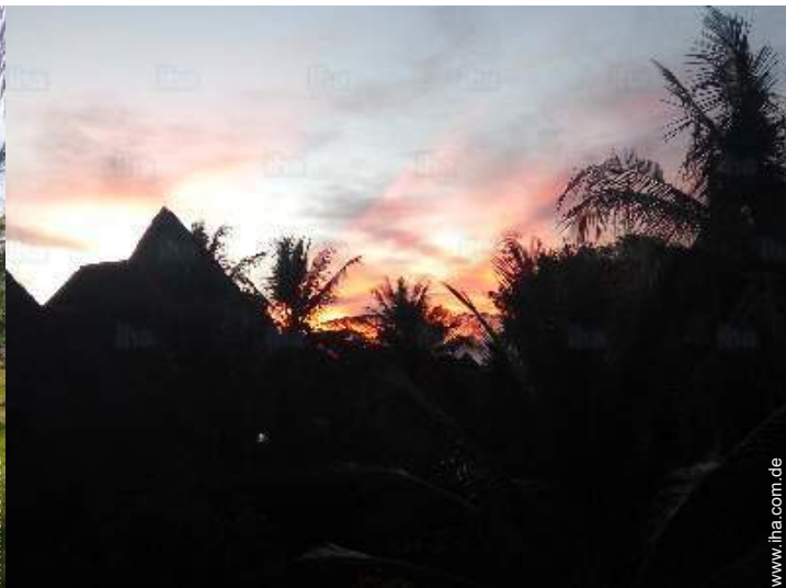
Ausblick überdachte Terrasse