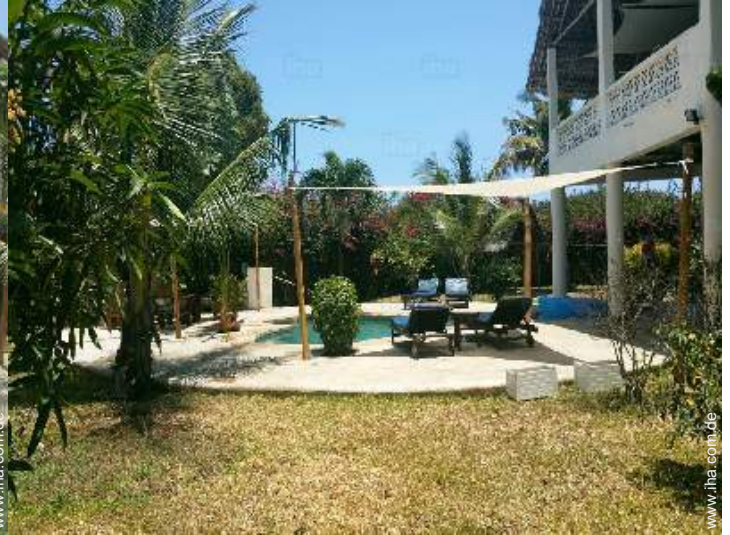
Blick auf Garten/Park