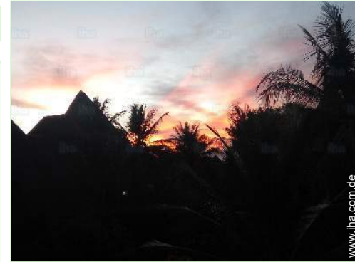
Ausblick überdachte Terrasse