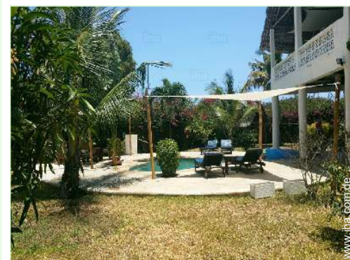
Blick auf Garten/Park