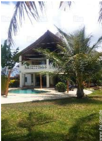
Blick auf Garten/Park