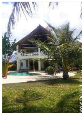
Blick auf Garten/Park