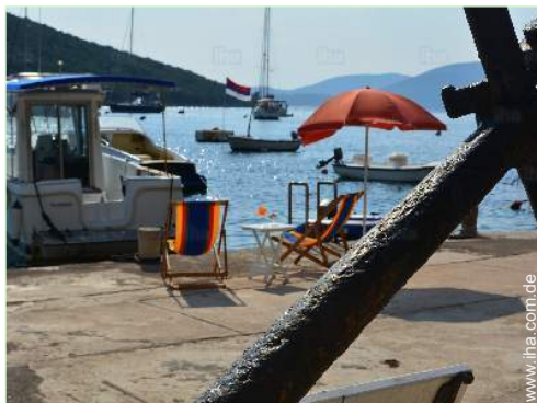
Blick aufs Meer

Besondere Vorzüge : Direkter Zugang zum Strand, Ankerplatz