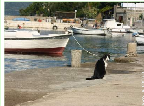
Blick aufs Meer