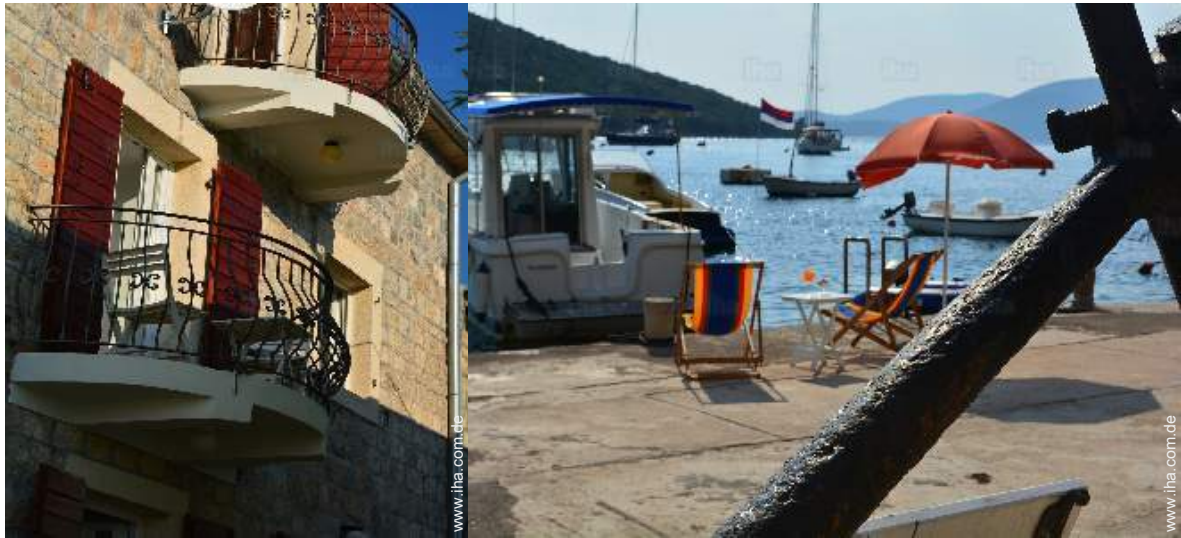
Blick aufs Meer