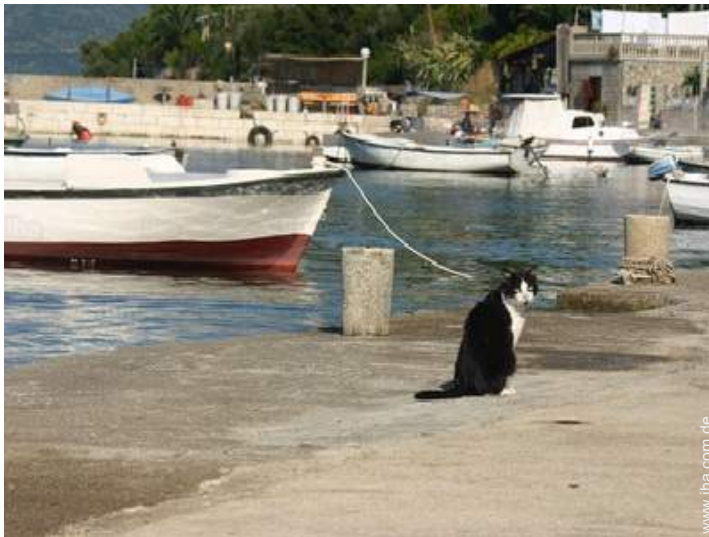
Blick aufs Meer