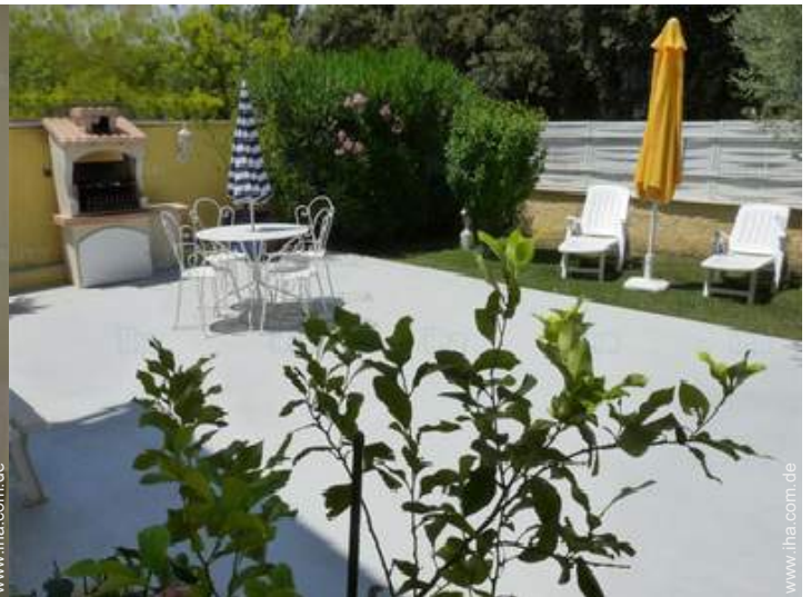
Blick auf Hof