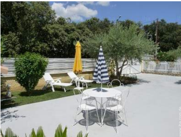
Blick auf Hof