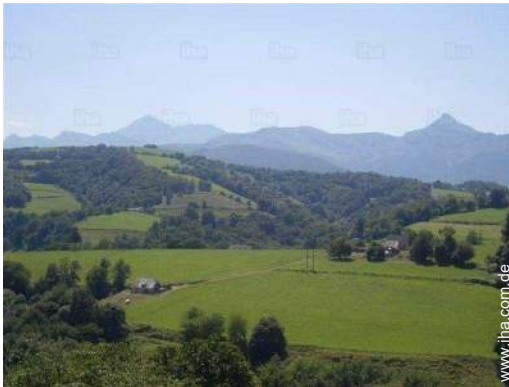
Blick auf Gebirge