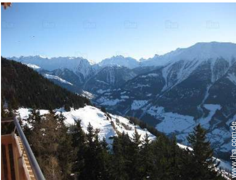
Blick auf Gebirge