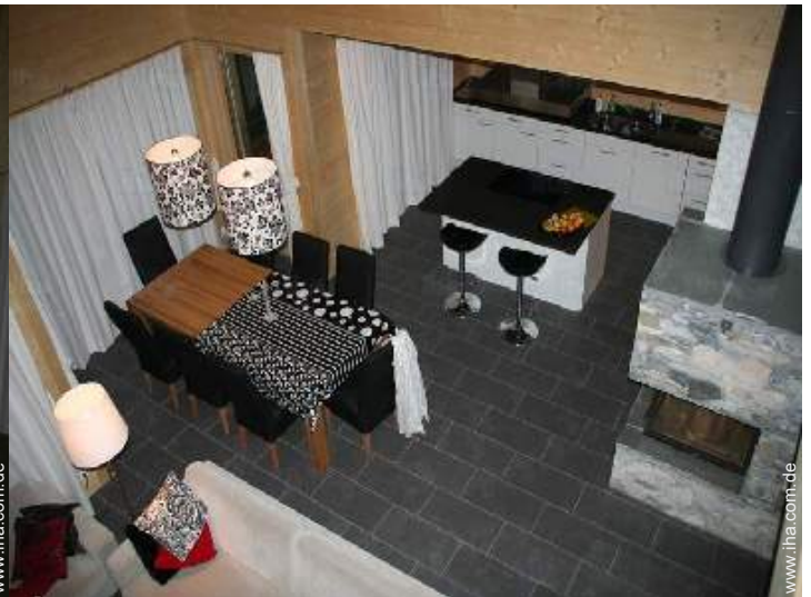
Raumaufteilung und Annehmlichkeiten