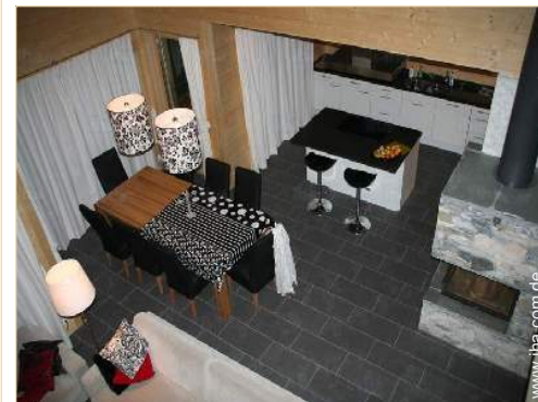
Raumaufteilung und Annehmlichkeiten

Dorfzentrum 100m Bushaltestelle 200m Fahrrad-/Mountainbikeverleih 100m Skiverleih 100m Wäscherei/Wäscheverleih <50m Bäckerei 300m Feinkosthändler 300m Örtliche Geschäfte 300m Supermarkt 200m Luxus-/Markenboutiquen 200m Friseursalon 300m Post 200m Bank 200m Geldautomat 200m Apotheke 200m Arzt 200m